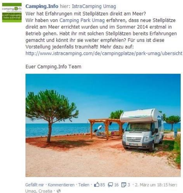
Esempio di un post su Facebook

Lo stesso post verrà pubblicato contemporaneamente su Facebook e sulla pagina Google+ di Camping.Info ( http://plus.google.com/+campinginfo ). Anche in questo caso il post verrà accompagnato dal link che conduce alla homepage del suo sito.